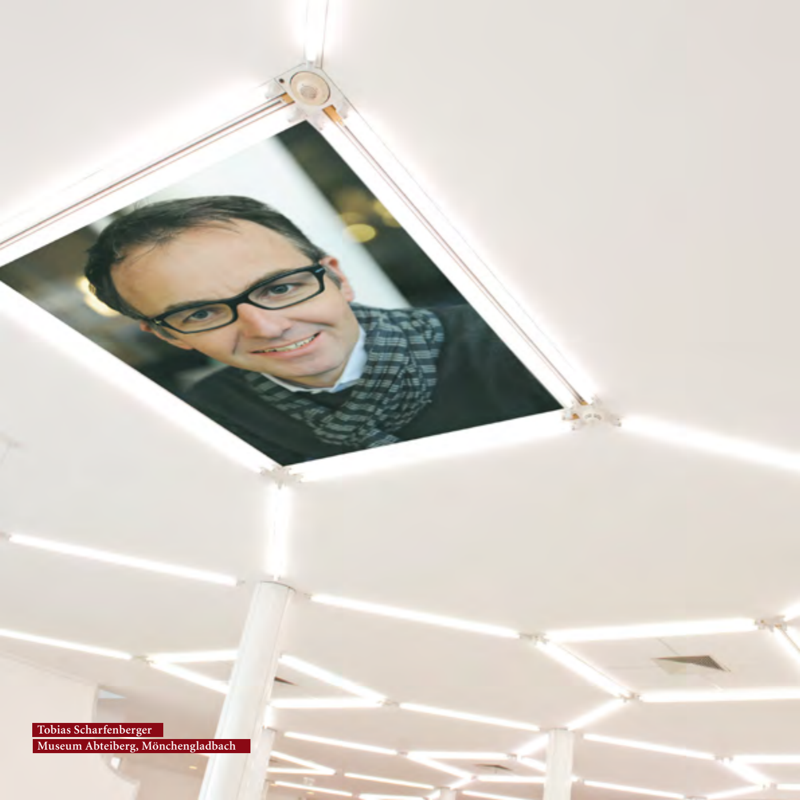
Tobias Scharfenberger Museum Abteiberg, Mönchengladbach

PREMIERE: Theater Krefeld am 12. Mai 2012 Theater Mönchengladbach in der Spielzeit 2012/2013 Erstmals am Theater Krefeld und Mönchengladbach