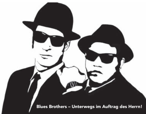
Blues Brothers – Unterwegs im Auftrag des Herrn!

23 Fr Studio GASTSPIEL Taubenvergiften für Fortgeschrittene Michael Frowin und Jochen Kilian präsentieren Georg Kreisler 19.30 Uhr · ★ Eintritt: 16,30 € / ermäßigt: 10,60 € 24 Sa Theaterball 2012 Wiener Blut 20 Uhr Einlass: 19 Uhr Eintrittspreise: 65,- € / 45,- € / 30,- € / 20,- € 25 So Die Liebe zu den drei Orangen Oper von Sergej Prokofjew 19.30 – 22.05 Uhr TheaterGemeinde S 6 / ★ Eintritt: ♦ II 19 Uhr Einführung Theatercafé Linol THEATER EXTRA Frühstücks-Matinee zu Der Goldene Drache von Roland Schimmelpfennig 11.15 Uhr, Frühstück ab 10 Uhr Eintritt Matinee: 3,- € Frühstück: 5,50 € Karten für die Matinee sind auch im Vorverkauf erhältlich. Frühstück kann an der Theaterkasse vorbestellt werden. 28 Mi Museum Abteiberg THEATER EXTRA | Redebühne 4:3 Gladbacher Feuilleton Live-Rezensionen und Diskussion 20 Uhr | Eintritt frei! 29 Do Kaiser-Friedrich-Halle 2. Chorkonzert Mit Werken von Wolfgang Amadeus Mozart 20 Uhr · Konzertabo / ★ 31 Sa Die Fledermaus Operette von Johann Strauß 20 – ca. 22.45 Uhr · Abo Grün 6 / ★ Eintritt: ♦ II